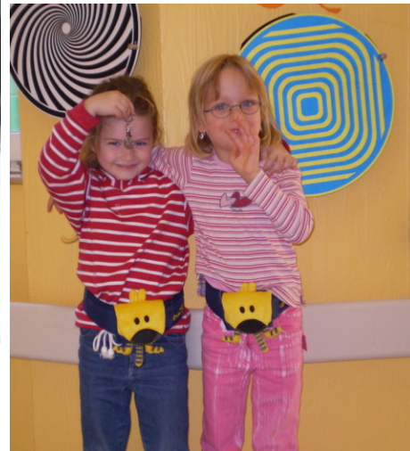
Subject 8 Masked Phase